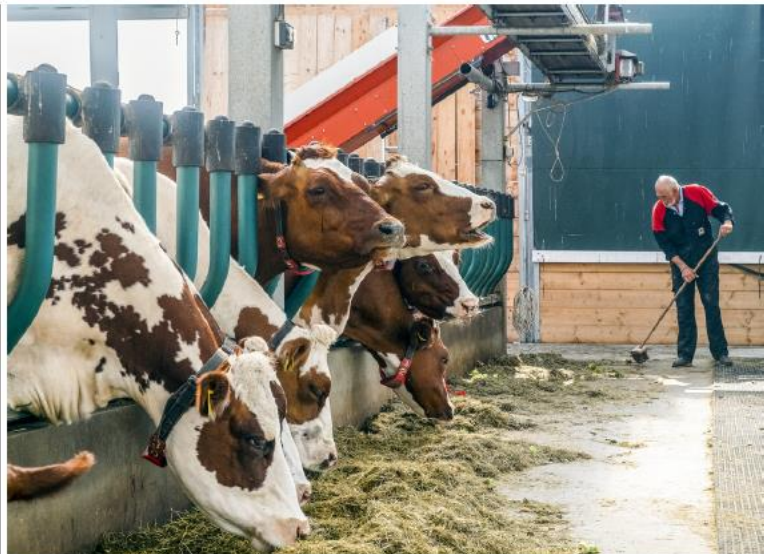
In de huidige stikstofplannen wordt geen rekening gehouden met stoppende landbouwers. Onterecht, zo vindt de Boerenbond. 10/10

De Boerenbond wil dat de zogenaamde Kritische Depositiewaarde (KDW) niet langer als een harde doelstelling wordt gebruikt. Die waarde is de grens waarboven een habitat significant wordt aangetast door de verzurende of vermestende invloed van de stikstofneerslag. "Neem nu het Turnhouse Vennegebied: daar liet de jaarlijkse erens op 6 kg stik-