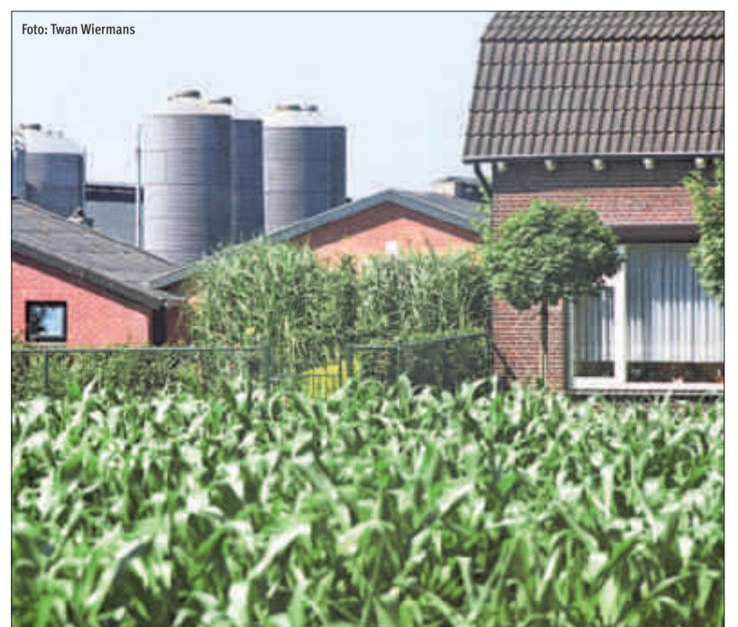
Bij aanvragen van vergunningen voor uitbreiding van bedrijven worden geregeld problemen gesignaleerd in verband met geurhinder.

Elke inrichting die in Vlaanderen potentieel hinderlijk of risicovol is, is ingedeeld in het 'Vlaams reglement betreffende de milieuvergunning', kortweg Vlarem. Landbouwbedrijven staan op de lijst van potentieel hinderlijke inrichtingen. Het kabinet van minister Schauvliege maakte in december een inventaris van de Vlaremknelpunten. Het Hoofdbestuur stelde een lijst op van problemen die zich voordoen in de landbouwbedrijfsvoering. Deze lijst werd overgemaakt aan het kabinet Leefmilieu.