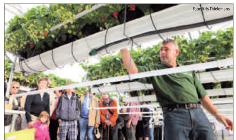
Bedankt aan allen die hebben bijgedragen aan de Dag van de Landbouw, die opnieuw een echt succes was.

De 28ste editie bewees dat land- en tuinbouwers het grote publiek aanspreken – door de zeer goede, soms zelfs massale opkomst op elk van de 50 opengestelde bedrijven en door zelf de rondleidingen te verzorgen of tijdens een losse babbel met de enthousiaste bezoekers. Onze Vlaamse land- en tuinbouwbedrijven lieten zien dat ze openstaan voor de vragen vanuit de maatschappij en de markt en dat ze met veel inzet en creativiteit antwoorden zoeken. Wie kiest om mee te werken aan de Dag van de Landbouw, doet dit meer dan ooit vanuit een overtuiging. Bedankt aan allen die op om het even welke manier hebben bijgedragen aan deze 28ste editie. De Dag van de Landbouw was opnieuw een echt succes, ondanks de concurrentie van de auto-loze zondag in sommige steden.