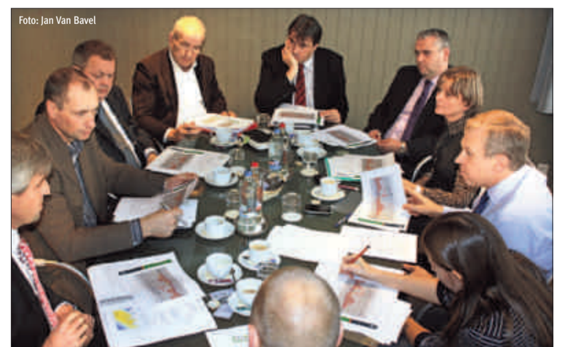
De Boerenbond zat rond de tafel met premier Leterme en federaal minister Laruelle.

In september ontvingen de Belgische landbouwministers hun Europese collega's op een informele vergadering van de Landbouwraad. Die gelegenheid namen ze te baat om de landbouwsector van ons eigen land en onze eigen regio in de kijker te plaatsen. Minister-president Kris Peeters, onze landbouwminister, nodigde zijn collega's uit op de Mechelse Veilingen en op de Wolkenhoeve in Geel. Hij nodigde ook de deelnemers aan het ketenoverleg uit, om aan de verzamelde Europese landbouwministers de onlangs afgesloten gedragscode voor te stellen. Daarmee bood Kris Peeters de Boerenbond een belangrijk platform om dit punt op de Europese agenda te plaatsen. ■