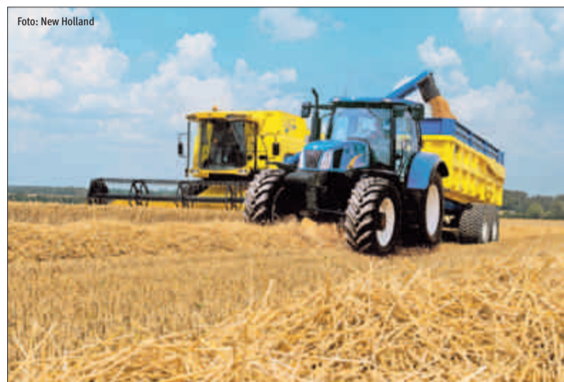
Globaal kende 2009 lagere prijzen voor de verkochte producten. Granen en melk waren hiervan de sprekendste voorbeelden.

De Boerenbond houdt eraan alle land- en tuinbouwers die meewerkten aan de gegevensinzameling voor de barema's en aan de voorbereidende besprekingen binnen de structuren van de organisatie te danken voor de geleverde inspanningen. Alleen dankzij hun inzet is het mogelijk om land- en tuinbouwforfaits tot stand te brengen, die toch een aanzienlijke administratieve vereenvoudiging voor de sector betekenen.