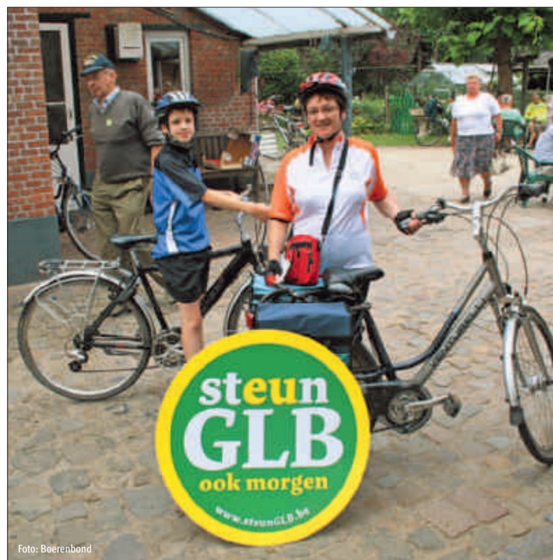
Gedurende de zomer sprak de Boerenbond het grote publiek aan. We trokken met de GLB-campagne naar de grote manifestaties van de Landelijke Gilden.

Gedurende de zomer sprak de Boerenbond het grote publiek aan. We trokken met de GLB-campagne naar de grote manifestaties van de Landelijke Gilden en op 15 augustus naar het tv-programma 'Villa Vanthilt'. In november telde de fotopetitie – waarvoor mensen poseerden met de GLB button – meer dan tweeduizend foto's.