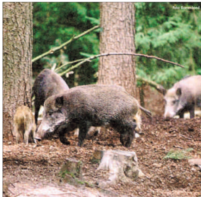
Doordat de evers geen natuurlijke vijanden hebben, neemt de everpopulatie sterk toe en de dieren richten steeds meer schade aan.

In oktober vond er een hoorzitting plaats in het Vlaams Parlement. Ook de Boerenbond werd er gehoord. Op het vlak van wildschade wees de Boeren-