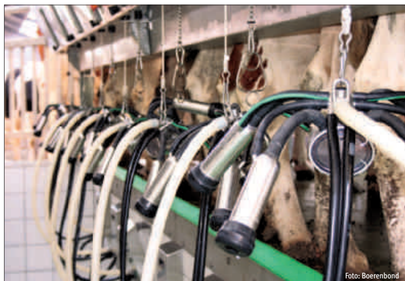
Dankzij het melkakkkoord met Fedis kwam er voor meerdere sectoren heel wat in beweging, in de hele productieketen.

Begin maart werd er plots een ministerieel besluit gepubliceerd, waarover zelfs geen advies werd gevraagd aan de Strategische Adviesraad voor Landbouw en Visserij (SALV). Het bouwde de financiële ondersteuning van het Bedrijfsadviesysteem (BAS) sterk af (-50%) en voerde een kredietbudget in. Het gevolg van deze zuivere besparingsmaatregel is dat de toelage niet meer in verhouding staat tot de totale kost van het systeem aan de boer. De Boerenbond vond dit niet aanvaardbaar, zeker in een periode van zware crisis voor de hele sector.