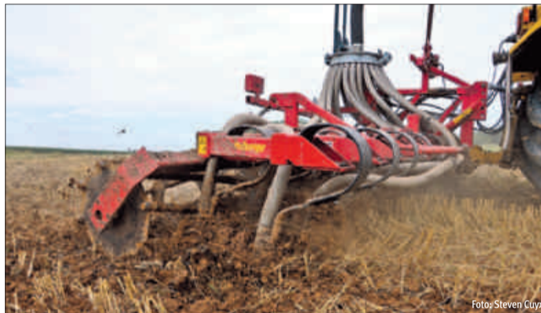
In april liepen de interne discussies rond het aangekondigde Mestactieplan 2011-2014 volop.

In april liepen de interne discussies rond het aangekondigde Mestactieplan 2011-2014 volop. De voorzitter had een bilateraal overleg met het kabinet Schauvliege, de intervakgroepenwerkgroep vergaderde geregeld en onze specialisten en vakgroepsecretarissen onderzochten mogelijke denksporen. Aan minister Schauvliege werd gevraagd om voor elke voorgestelde maatregel een economische en administratieve impactanalyse te maken. We moesten immers vermijden dat nieuwe maatregelen de administratieve lasten op onze bedrijven zouden verhogen en we moesten de economische draagkracht van onze dierlijke productiesector in het oog houden.