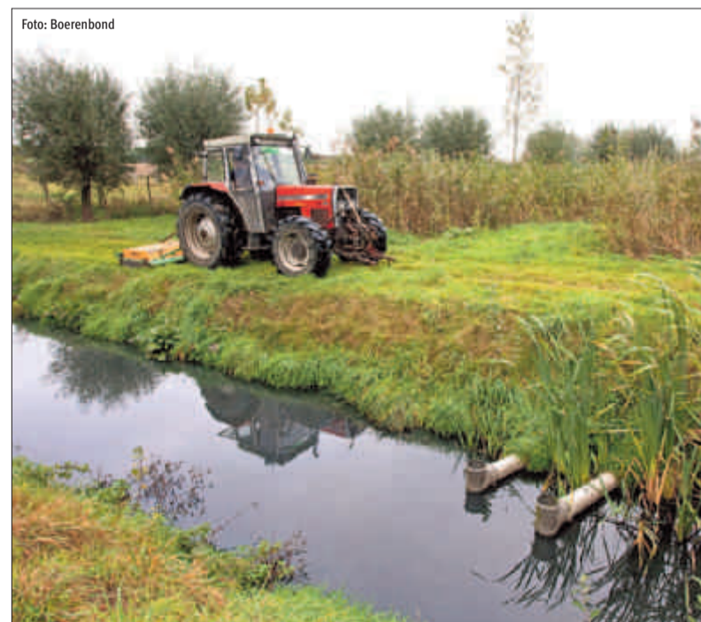
De Vlaamse regering kwam tegemoet aan de vraag van de Boerenbond om de gemeentelijke vergoeding niet aan te rekenen aan landbouwbedrijven die geen afvalwater lozen in rioleringen of grachten.

Omdat het duidelijk niet haalbaar was om die goede toestand in Vlaanderen te bereiken tegen 2015, werkte men in het plan een gespreide aanpak uit. Voor 7 oppervlaktewaterlichamen en voor 7 grondwaterlichamen werd een goede toestand in 2015 vooropgesteld. Voor de overige 195 oppervlaktewaterlichamen en 35 grondwaterlichamen werd in de plannen gemotiveerd dat Vlaanderen meer tijd nodig heeft om de maatregelen uit te voeren. Bij de plannen hoort ook een uitgebreid maatregelenprogramma. Er zijn 147 aanvullende maatregelen, waarvan er 127 met een beperkt budget te realiseren zijn. Zes dure maatregelen, waaronder erosiebestrijding, kregen al een budget. De 14 overige maatregelen, waaronder de aanleg van grasbufferstroken langs waterlopen en de ontwikkeling van een actief peilbeheer, zouden een jaarlijks budget van meer dan 236 miljoen euro vereisen. Vermits deze meerkost niet